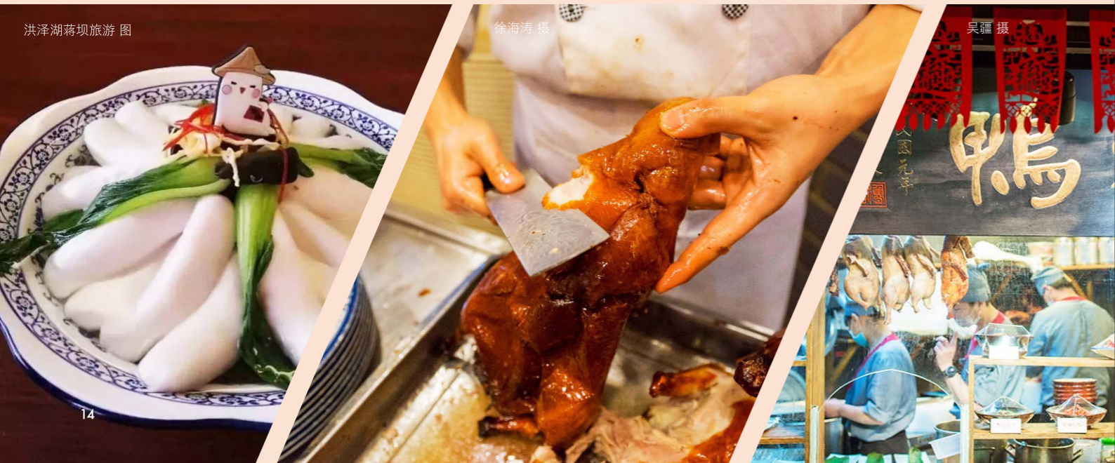
洪泽湖蒋坝旅游 图