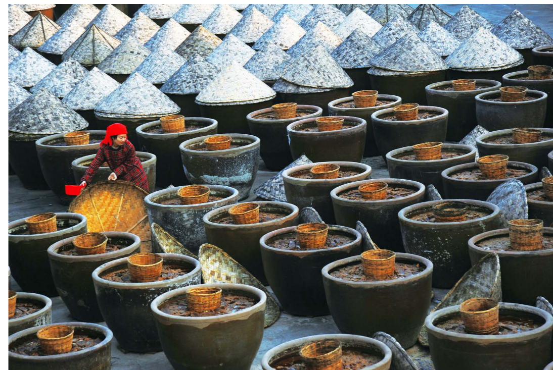
徐州窑湾赵信隆酱园店的网红“斗笠”。