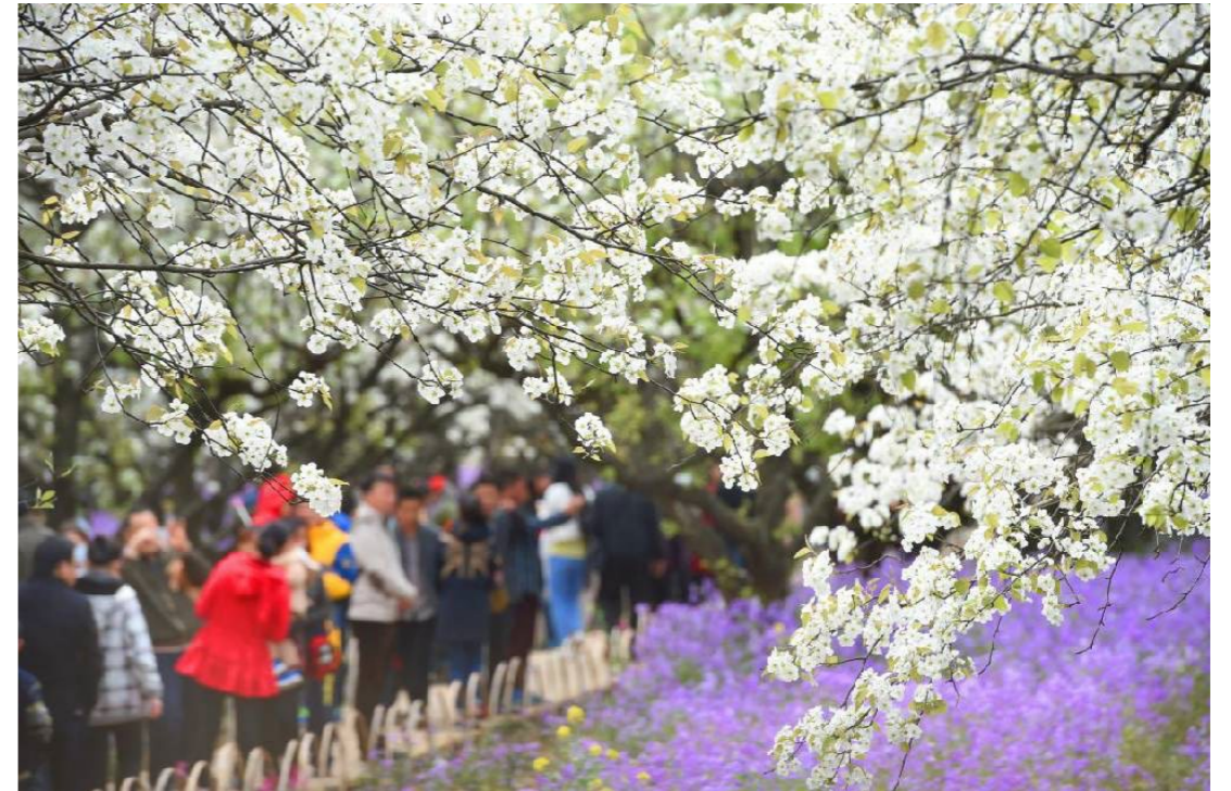
宿迁三台山国家公园梨兰盛开