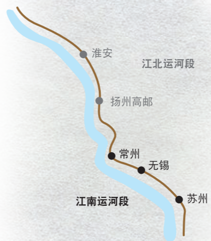
江苏运河游示意图